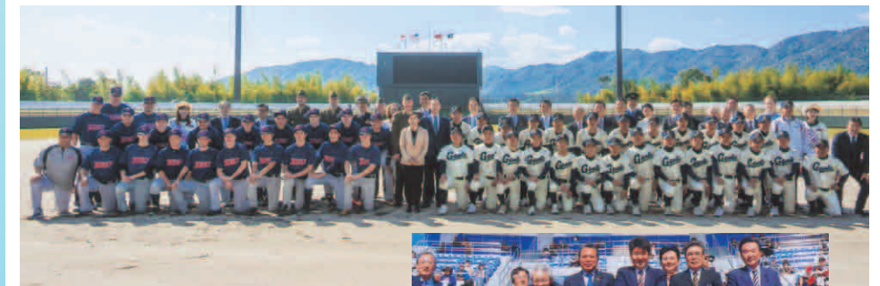
絆スタジアム完成 日米高校親善野球大会