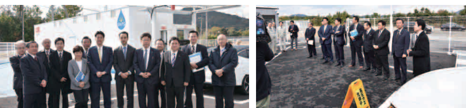
長州産業 水素ステーション 手前が水素燃料車