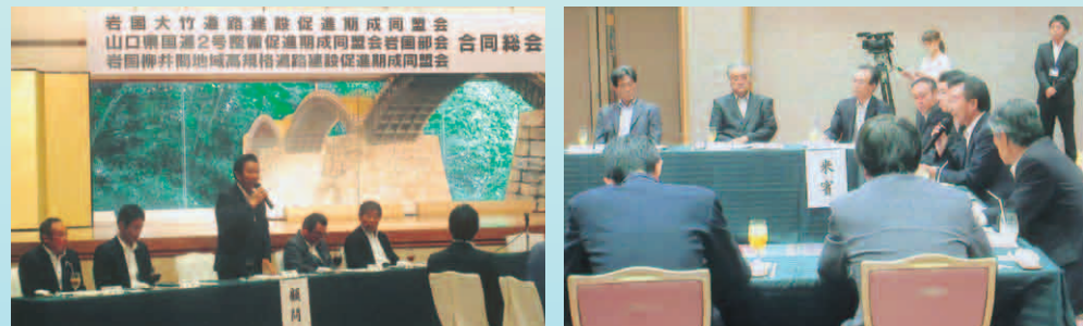
岩国大竹・国道188号・岩国柳井間期成同盟会 合同総会