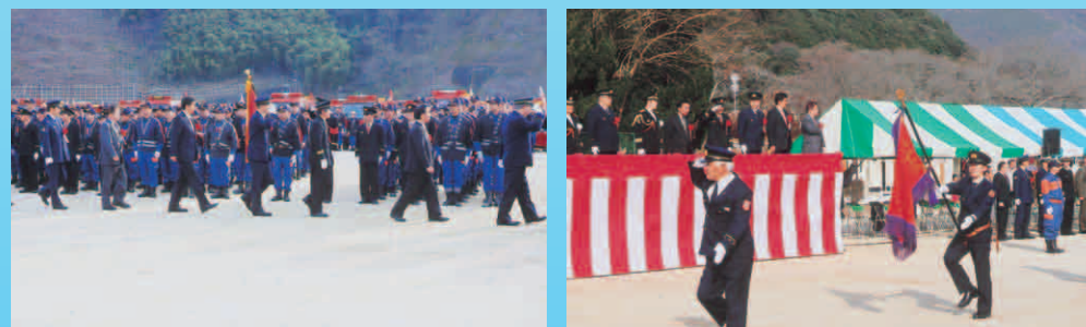
岩国市消防出初式