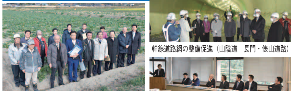
集落営農法人連合体の運営・取組（長門市三隅農場）