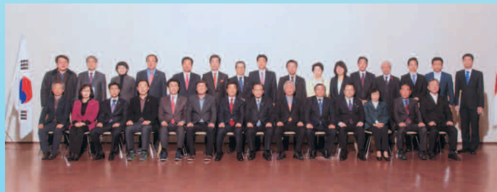
慶尚南道議会 議長団来県 歓迎会