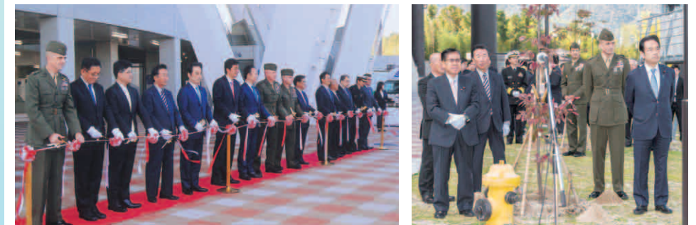
日米友好親善記念式典