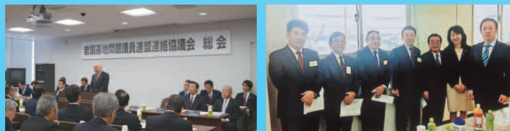
岩国基地問題議員連盟連絡協議会総会