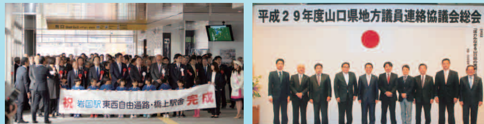
岩国駅東西自由通路・橋上駅舎完成