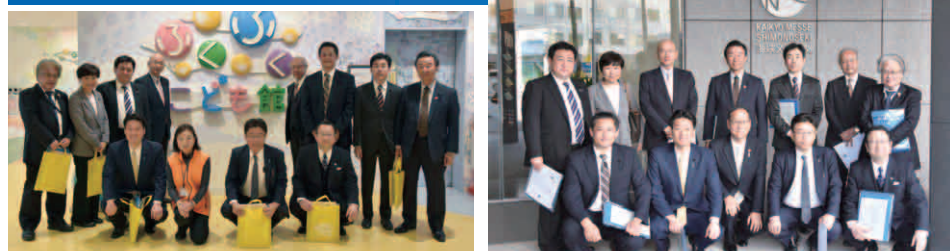
次世代育成支援拠点施設（下関市）