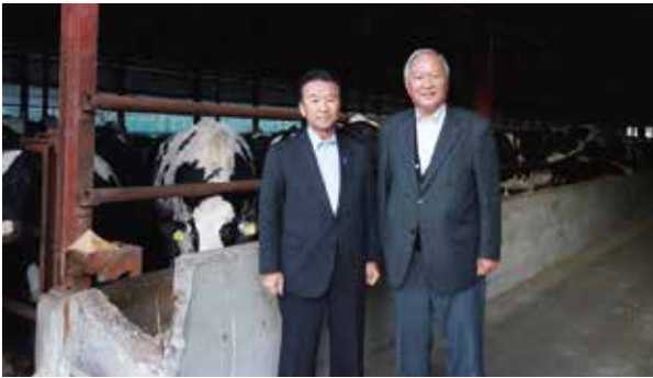
北海道一肉牛飼育（5,500頭）