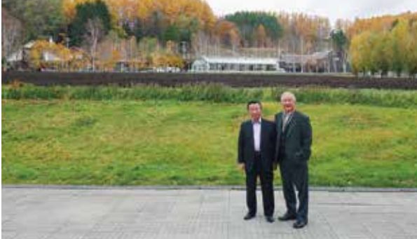
管 理 棟