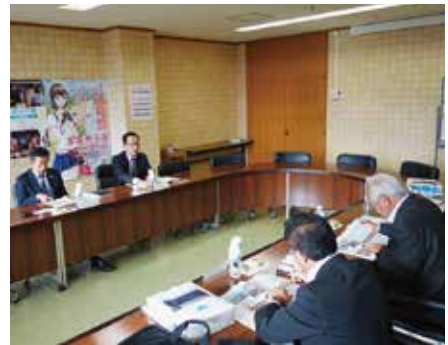
町役場（旭川空港隣町） 上水道（地下水豊富）下水道のないまち