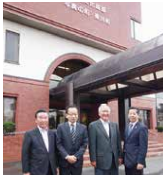
副町長・担当課長