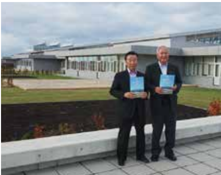
地域交流センター・東川ゆめ公園