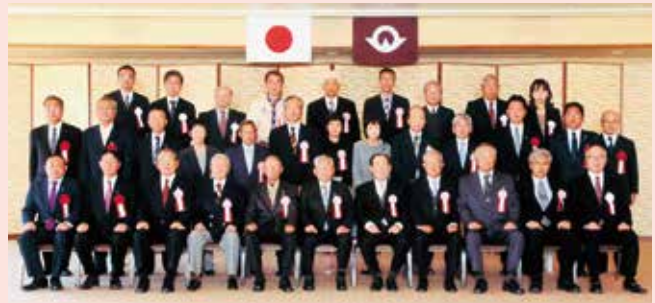
県教育委員会教育功労者表彰式