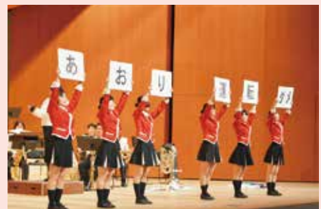
音楽隊カラーガード