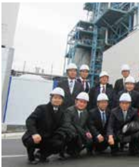
防府バイオマス・石炭混焼発電所