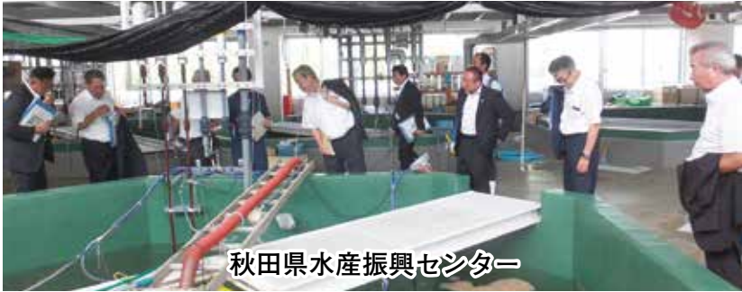
秋田県水産振興センター