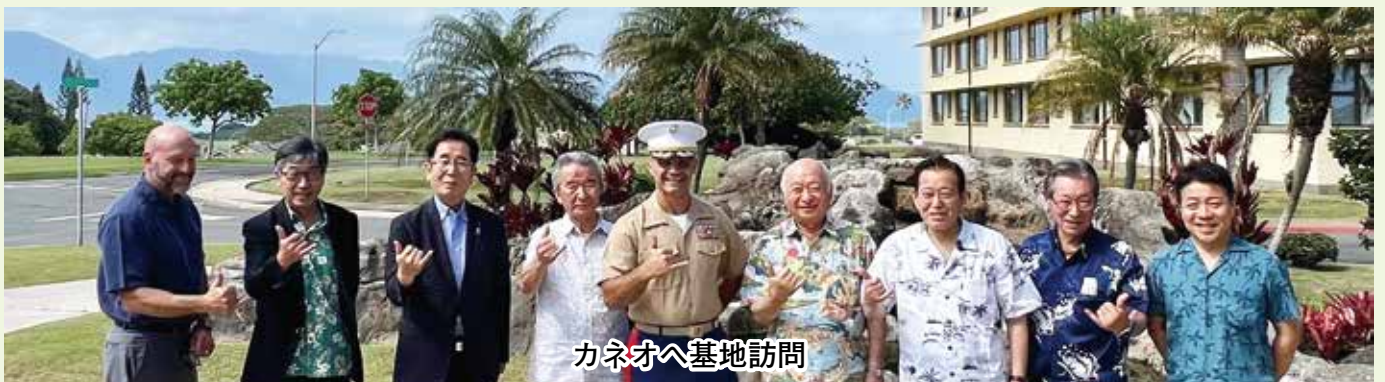
カネオヘ基地訪問