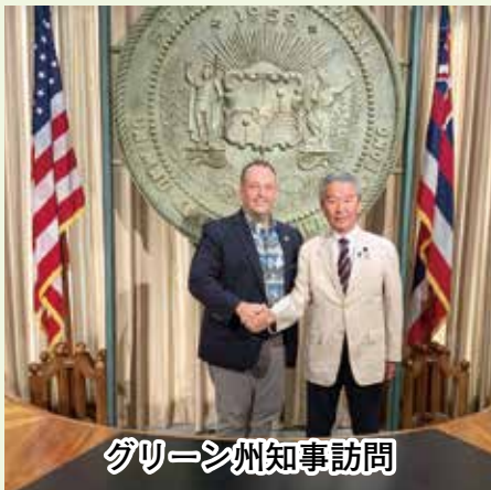
グリーン州知事訪問