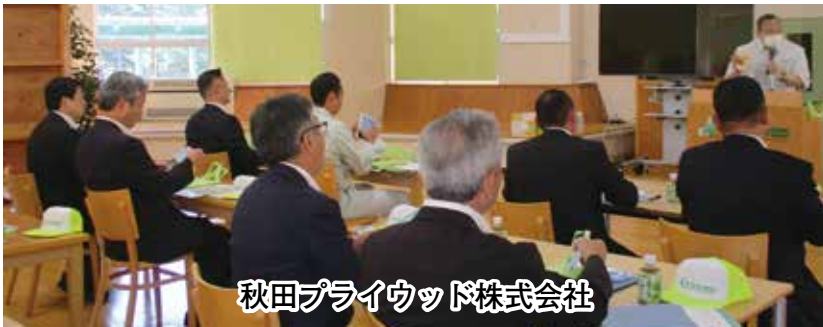
秋田プライウッド株式会社