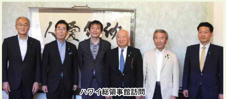
ハワイ総領事館訪問