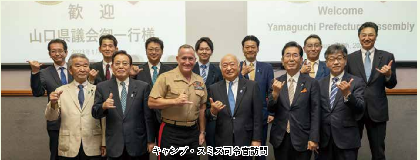
キャンプ・スミス司令官訪問