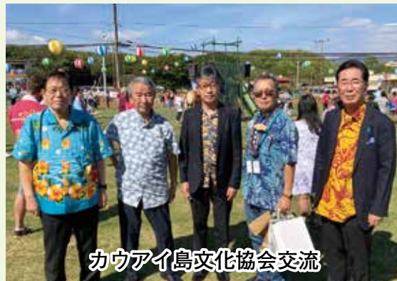
カウアイ島文化協会交流