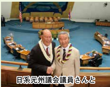
日系元州議会議員さんと