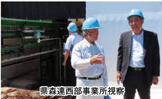
県森連西部事業所視察